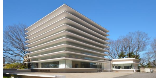
ゐのはな同窓会館

JR 千葉駅 東口7番バス乗り場、京成バス「千葉大学病院」または「南矢作」行バス、約15分、「千葉大看護学部入口」下車