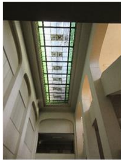
玄関吹抜けホールと ステンドグラス