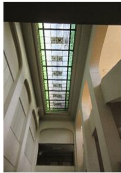
玄関吹抜けホールと ステンドグラス