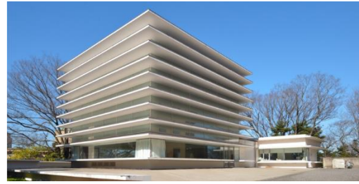
みのはな同窓会館

JR 千葉駅 東口 7 番バス乗り場、京成バス「千葉大学病院」または「南矢作」行バス、約 15 分、「千葉大看護学部入口」下車